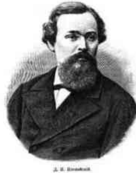
Д. Н. Иловайский