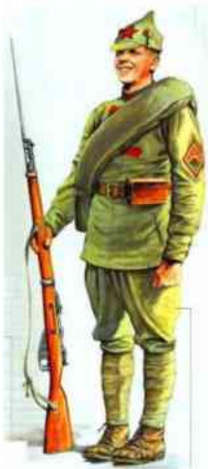
Красноармеец стрелковых полков РККА, летняя форма обр. 1920 г.